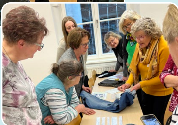
Multiplikatorentagung 2025, Fulda