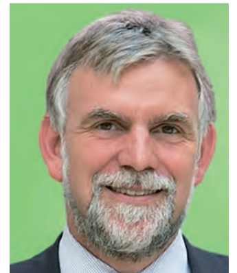
Jochen Flasbarth Präsident des Umweltbundesamtes