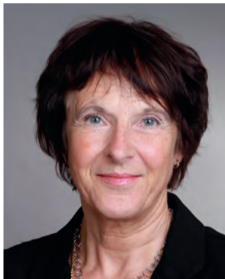
Maria Krautzberger Präsidentin des Umweltbundesamtes