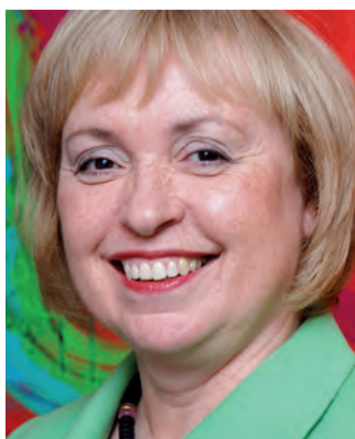
Prof. Dr. Maria Böhmer Beauftragte für Migration, Flüchtlinge und Integration der Bundesregierung