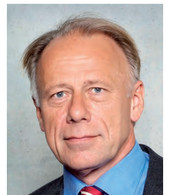
Jürgen Trittin Bundesminister für Umwelt, Naturschutz und Reaktor- sicherheit