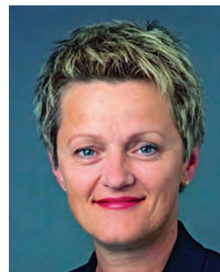
Renate Künast Bundesministerin für Verbraucherschutz, Ernäh- rung und Landwirtschaft