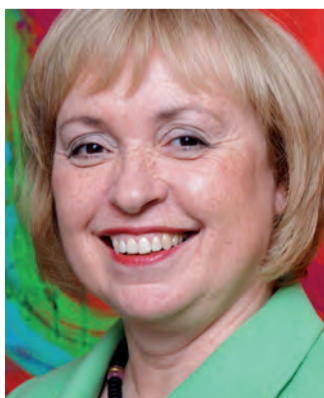
Prof. Dr. Maria Böhmer Beauftragte für Migration, Flüchtlinge und Integration der Bundesregierung