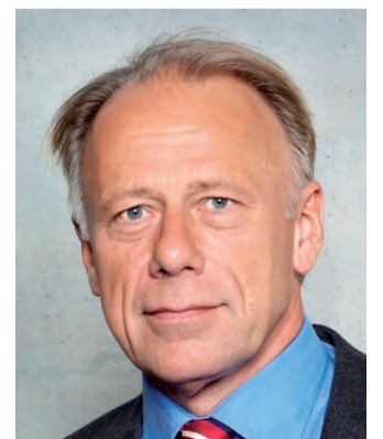
Jürgen Trittin Bundesminister für Umwelt, Naturschutz und Reaktorsicherheit